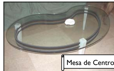
Mesa de Centro $150.00

Para información llamar a Brenda Massanet (787) 630-7568