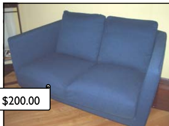
Love Seat $200.00