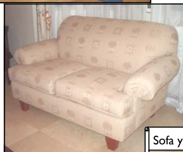
Sofa y Love Seat $600

Para información llamar a Brenda Massanet (787) 630-7568