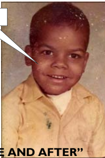
“BEFORE AND AFTER”